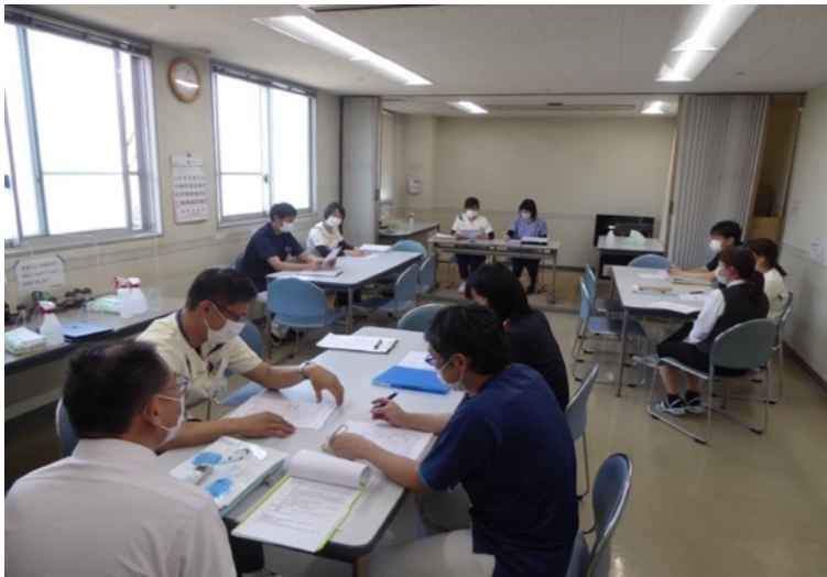
医療安全管理部会