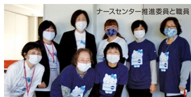
ナースセンター推進委員と職員

※バスの運行・発着時刻については運営会社のホームページで確認をお願いいたします。