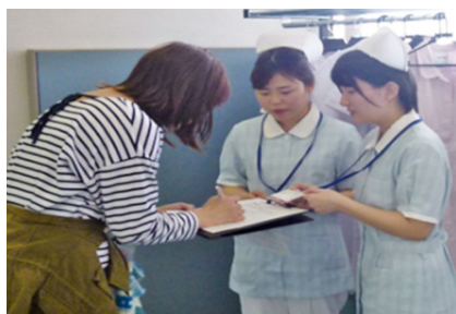
骨密度測定の受付様子

◆◆◆◆◆ 国保野上厚生総合病院附属看護専門学校 の学生さんもお手伝いに来てくださ いました。