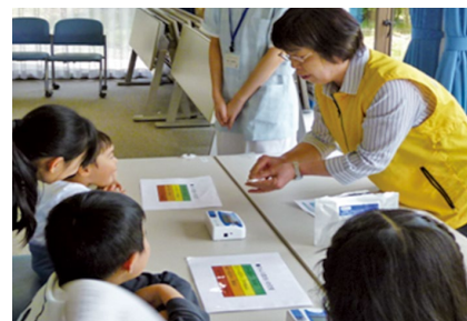
唾液アミラーゼ測定の様子

当日は和歌山県PRキャラクター「きいちゃん」も「ナースディフェスタ和歌山」のPRにかけつけてくれました。