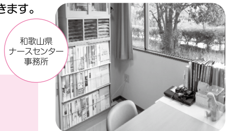
和歌山県 ナースセンター 事務所

◎ナースセンター(海南市南赤坂17)では、9時から16時30分(月～金)まで相談をお受けしています。※平日の来所がご無理な方はご連絡ください。(メール・郵送等で対応させていただいています。)