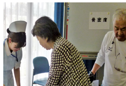
骨密度測定の受付様子