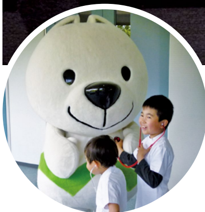
「きいちゃん」の心音聴取しています!

人とのコミュニケーションについて悩んでいた ので、色々なことを知れてとてもよかったです。 明日から意識して取り組んでみたいと思いました。 救命救急のユニフォーム、ナース服も着 れてよかったです。