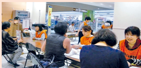
一日まちの保健室

乳がん自己検診 保健師による乳房モデルを用いた乳がん自己検診を実施しました。高校生の方から幅広い年代の方々が参加しました。「自分では、しこりというのは、どんなものかわからなかったので、今回参加することで確認できました」との声もありました。