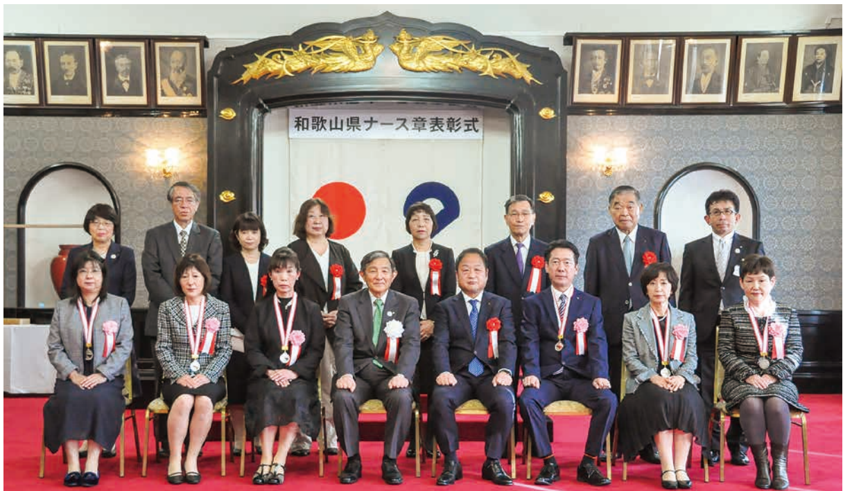
*今年はコロナ感染症予防のため、密を避けて2グループに分かれて写真撮影されました。