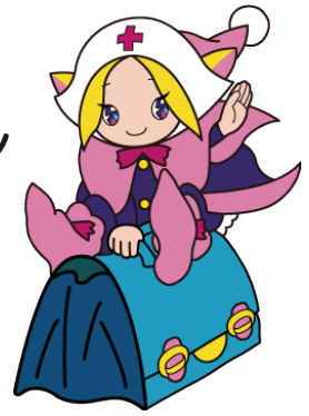
ウェルビーちゃん

訪問看護ステーションウェルビーは、1995年4月に開設され、今年で25年になります。スタッフは、看護師6名・理学療法士7名・作業療法士3名・言語聴覚士1名・事務員1名で、看護師は24時間緊急対応を行っています。利用者様は、橋本市・かつらぎ町・九度山町の方で、240から250名の方に登録をして頂いています。