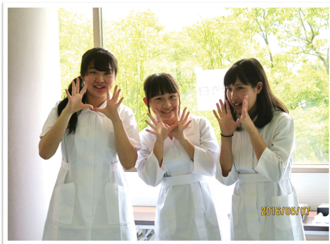
5月7日「看護の日」記念事業 白衣体験コーナーで 於:看護研修センター