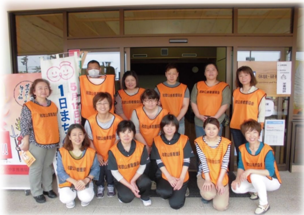
5月14日一日まちの保健室 於:道の駅柿の郷くどやま