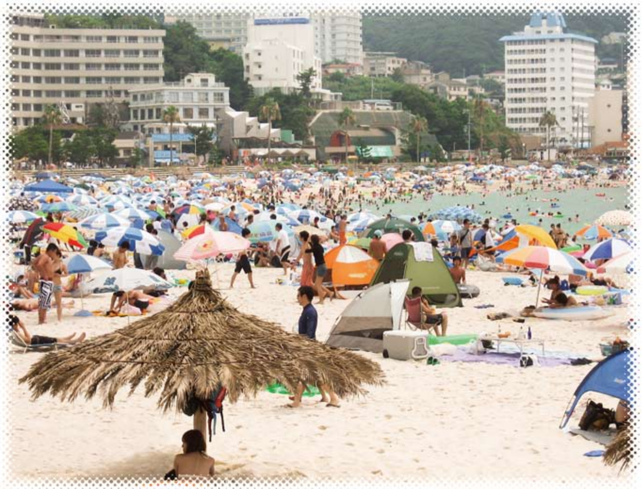
白浜 白良浜海水浴場