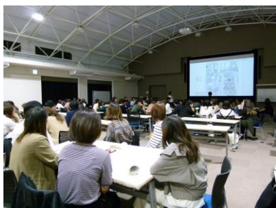
グループワークでは、事例を見ながら危険を予知している