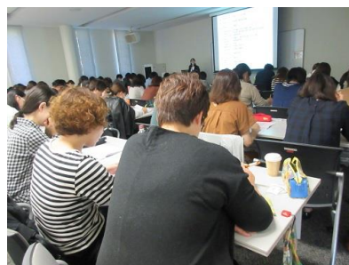
隣と相談中 話し合ったことを資料に 書き込み