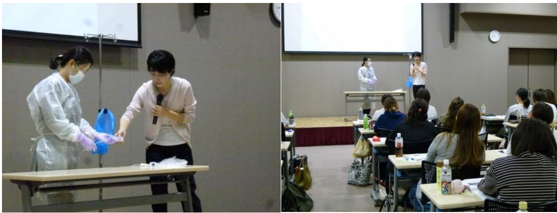
《暴露予防デモンストレーションの様子》