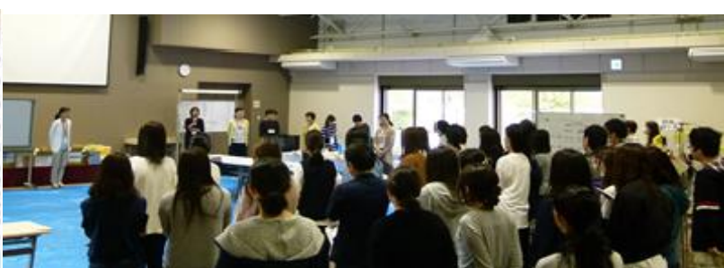
《指導者による総評》