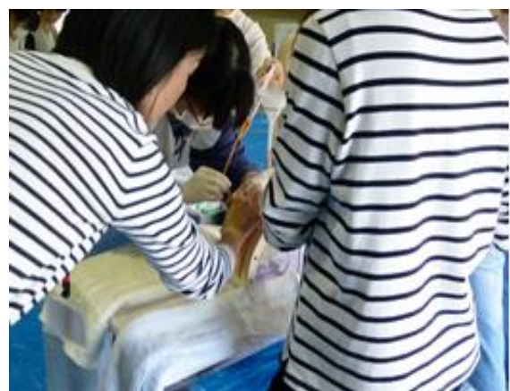
《膀胱留置カテーテル演習の様子》