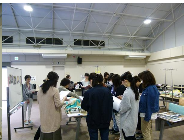
《経管栄養演習の様子》